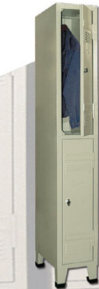
Vestiaire simple coupé en deux