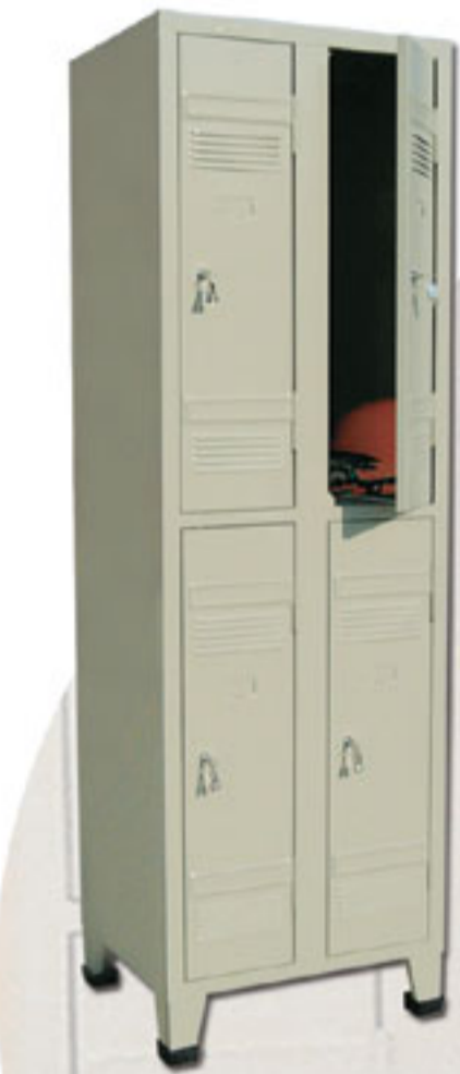
Vestiaire double coupé en deux

Des paumelles : longeant toute la largeur de la porte, constituent des renforts supplémentaires.